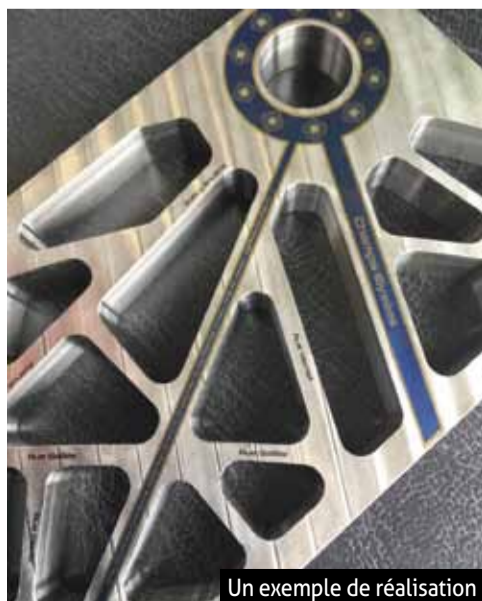
Un exemple de réalisation

4 Allée de la Hardt, 68440 Schlierbach 03 89 39 00 70 www.chemlaser.fr